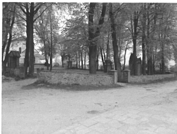
Krypno Kościelne, Fragment ogrodzenia cmentarza przykościelnego 2015 r.

Wystrój wnętrza kościoła realizowano etapami. Z poprzedniego kościoła przeniesiono klasycystyczny drewniany ołtarz Matki Boskiej Różańcowej z 1849 roku. Ołtarz główny drewniany, dwukondygnacyjny, polichromowany i złożony. W drugiej kondygnacji zawieszono słynący łaskami obraz Matki Boskiej z dzieciątkiem w złożonej XVIII wiecznej ramie. Obraz datowany na XVI względnie na XVII wiek.