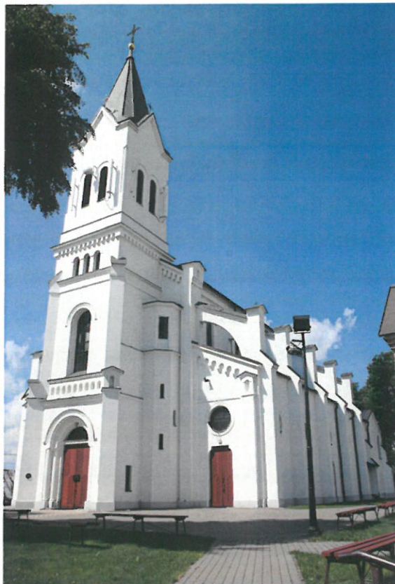
Kościół parafialny w Krypie. Fot. M. Andron 2020

Kościół par. p.w. Narodzenia NMP wpisany jest do rejestru zabytków województwa podlaskiego pod nr: A-122, dec. z dnia 26.09.1988. Jednocześnie do rejestru zabytków tą samą decyzją wpisano cmentarz przykościelny z XVII wieku oraz ogrodzenie z kaplicami.