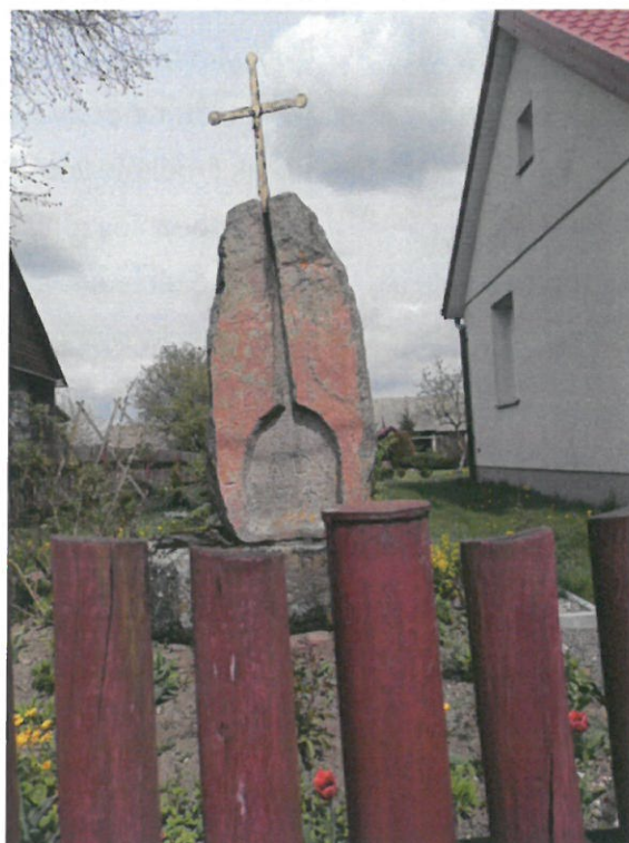
Góra, stela z krzyżem, fot. B. Tomecka 2015 r

W czasie weryfikacji obiektów o wartościach zabytkowych, ustalono, że w zagrodzie nr 33 we wsi Góra znajduje się kamienna stela z krzyżem i inskrypcją A.D. / 1747. Należałoby rozważyć objęcie jej ochroną konserwatorską.