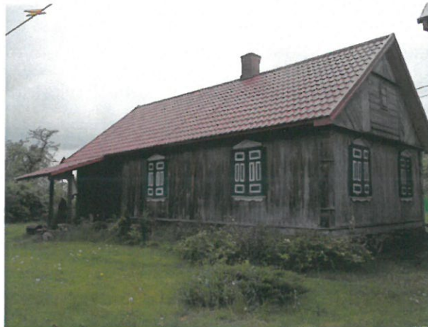
Krypno Wielkie 119.