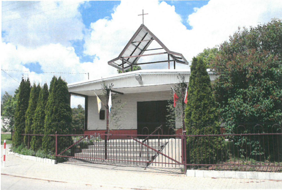
Kapliczka p.w. NMP Królowej Polski, fot. M. Andron 2020