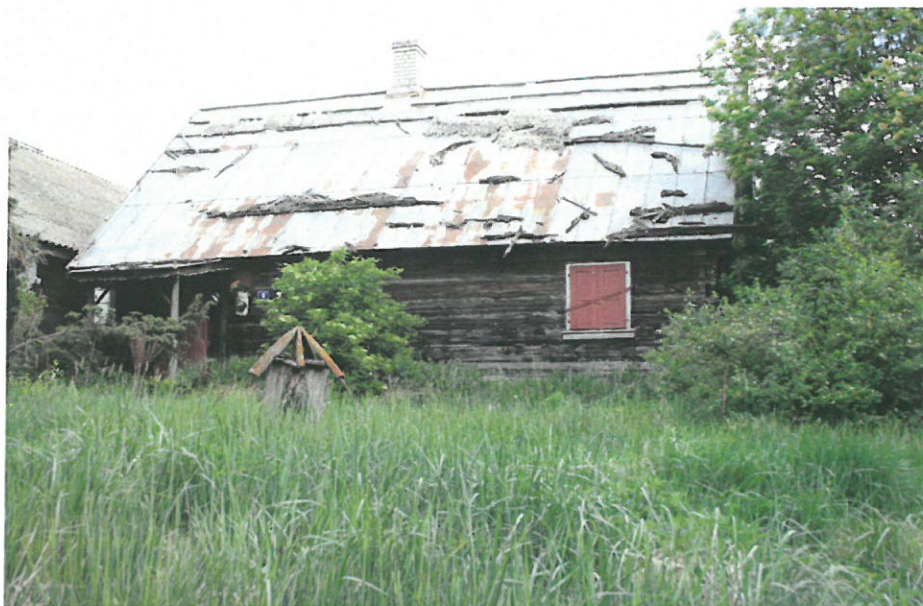
Morusy 6. Fot. M. Andron 2020 r.