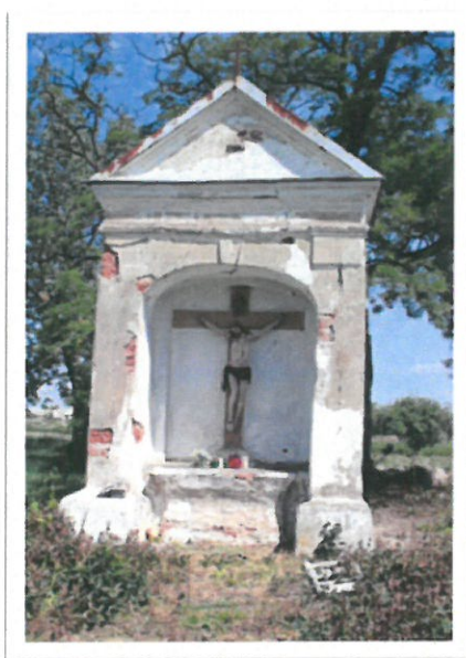
Bajki Zalesie, kapliczka z krucyfiksem. Fot. M. Andron 2013

Do zabytków ruchomych wpisanych do rejestru należy przede wszystkim wyposażenie kościoła parafialnego w Krypnie. Wykaz wszystkich zabytków ruchomych umieszczony został w załączniku nr 3. Obok znajdujących się w dobrym stanie przedmiotów z wyposażenia kościoła, cennym zabytkiem jest pochodząca z pocz. XIX wieku kapliczka dworska wraz z krucyfiksem we wsi Bajki Zalesie.